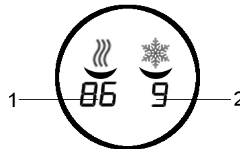
Рис.2 Дисплей аппарата V760C...